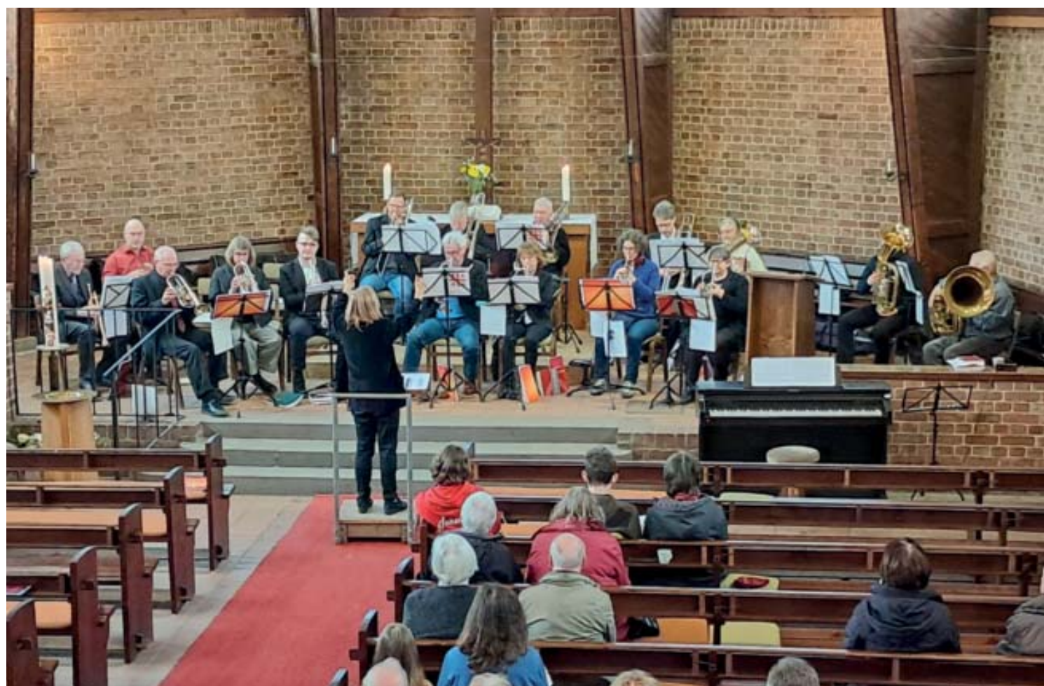
Posaunengottesdienst am 15. März 2026

Es musizieren die Posaunenchöre der Marien- und Erlöserkirchgemeinde und der Dreifaltigkeitskirchgemeinde.